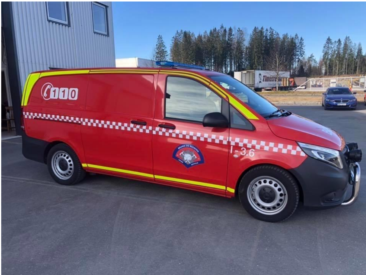
Foto: En av to nye fremskutte enheter levert til stasjonene Spydeberg og Skiptvet. De er merket med I-3.6 og I-4.6.